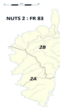
Figure 1: Aire géographique "Lignum Corsica®"

Pour les produits pour lesquels il n'existe pas de solution de transformation en Corse, il est permis de réaliser cette transformation en dehors de l'aire géographique, selon les règles établies dans l'article 2.6.3 : « série de produits sous-traités ».